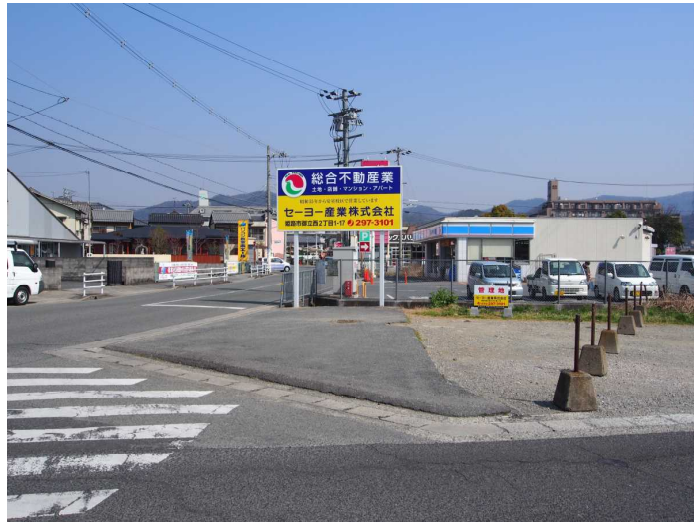
現地案内図・物件図面